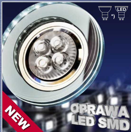
ART. 2226941 klasa energtryczna: A++ do E SS-23 CH/TR GU10 50W+SMD 230V BIAŁY 2,1W CHROM OPR. STROP. STAŁA OKRĄGŁA SZKŁO TRANSPARENTNE; moc max: GU10 MAX 50W + SMD 2,1W efektywność świetlna: 110 lm/W temperatura barwowa: 6500 K; trwałość LED: 20000 h