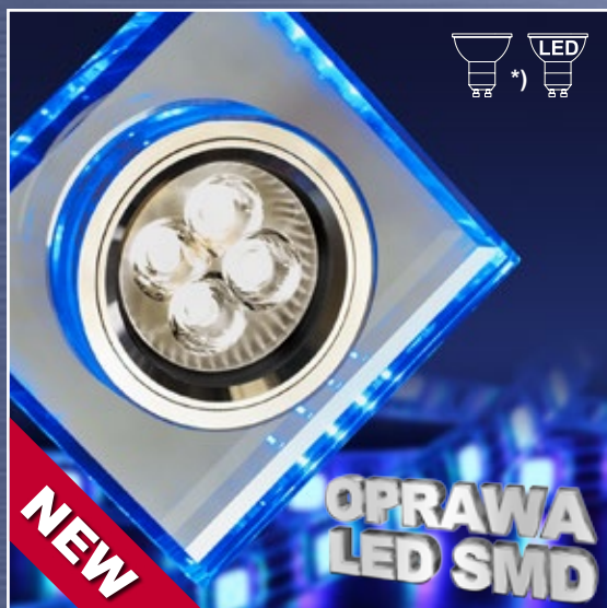
ART. 2226934 klasa energtryczna: A++ do E SS-22 CH/TR GU10 50W+SMD 230V NIEBIESKI 2,1W CHROM OPR. STROP. STAŁA KWADRATOWA SZKŁO TRANSPARENTNE; moc max: GU10 MAX 50W + SMD 2,1W efektywność świetlna: 110 lm/W temperatura barwowa: 6500 K; trwałość LED: 20000 h