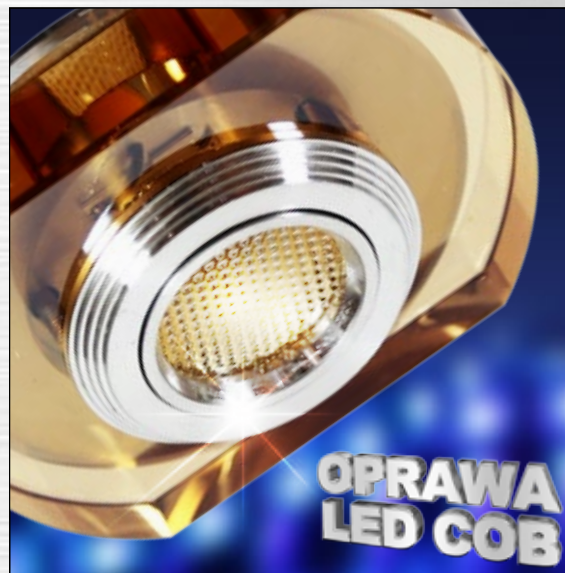
ART. 2228914 klasa energooszczędna: A+ SS-34 AL/AM 3W LED COB 230V OPR. STROP. STAŁA ZAKRĄGLONA SZKŁO BURSZTYNOWE; moc max: LED COB 3W; efektywność świetlna: 90 lm/W; temperatura barwowa: 3000 K; trwałość LED: 20000 h