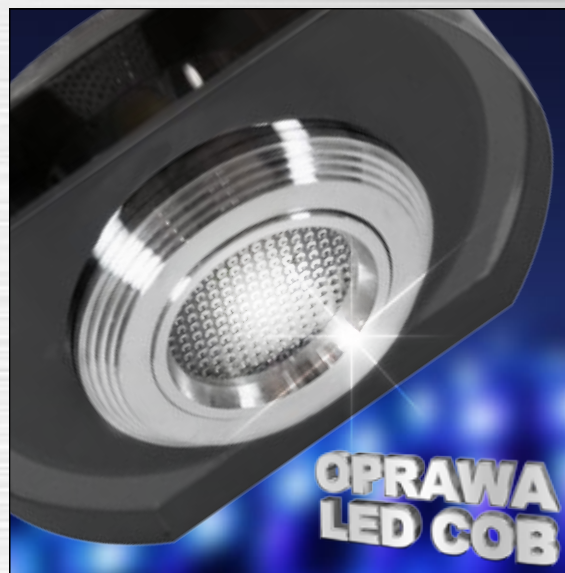
ART. 2228921 klasa energooszczędna: A+ SS-34 AL/BK 3W LED COB 230V OPR. STROP. STAŁA ZAKRĄGLONA SZKŁO CZARNE; moc max: LED COB 3W; efektywność świetlna: 90 lm/W; temperatura barwowa: 3000 K; trwałość LED: 20000 h