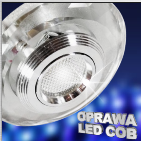
ART. 2228945 klasa energooszczędna: A+ SS-36 AL/TR 3W LED COB 230V OPR. STROP. STAŁA STOŻKOWA SZLIFOWANA SZKŁO TRANSPARENTNE moc max: LED COB 3W; efektywność świetlna: 90 lm/W temperatura barwowa: 3000 K; trwałość LED: 20000 h