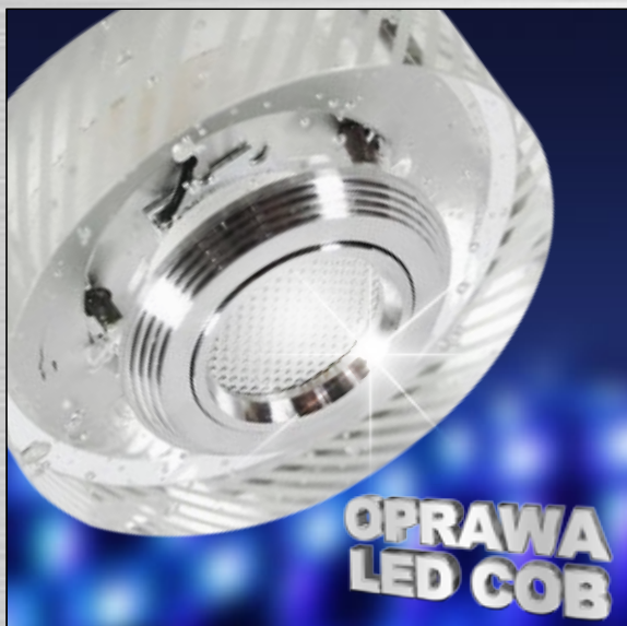
ART. 2228815 klasa energooszczędna: A+ SS-33 AL/TR 3W LED COB 230V OPR. STROP. STAŁA OKRĄGŁA SZKŁO TRANSPARENTNE; moc max: LED COB 3W; efektywność świetlna: 90 lm/W; temperatura barwowa: 3000 K; trwałość LED: 20000 h

*) Możliwość stosowania źródeł światła typu LED lub HAOGEN. Nie znajdują się one w opakowaniu. Wszystkie oprawy LED SMD i COB są wyposażone w źródła światła LED montowane na stałe. W oprawach typu LED SMD znajdują się również gniazda dla źródeł światła (sprzedawane oddzielnie) o różnych klasach energooszczędnych.