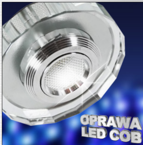
ART. 2228822 klasa energooszczędna: A+ SS-37 AL/TR 3W LED COB 230V OPR. STROP. STAŁA WIELOKĄT SZKŁO TRANSPARENTNE; moc max: LED COB 3W; efektywność świetlna: 90 lm/W; temperatura barwowa: 3000 K; trwałość LED: 20000 h