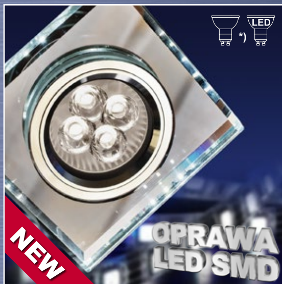
ART. 2226927 klasa energtryczna: A++ do E SS-22 CH/TR GU10 50W+SMD 230V BIAŁY 2,1W CHROM OPR. STROP. STAŁA KWADRATOWA SZKŁO TRANSPARENTNE moc max: GU10 MAX 50W + SMD 2,1W efektywność świetlna: 110 lm/W temperatura barwowa: 6500 K; trwałość LED 20000 h