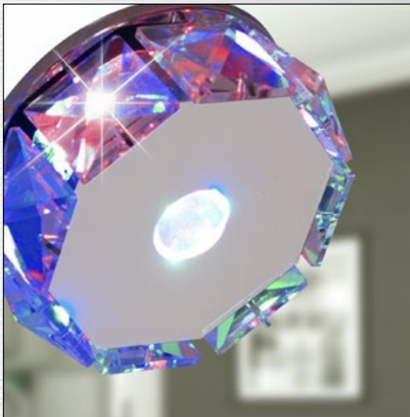
ART. 2235080 klasa energtryczna: A+ SK-84 CH/TR 3W LED RGB 230V CHROM OPR. STROP. DEKORAC. WIELOKĄTNA KRYSTAŁ; trwałość LED: 20000 h moc max: LED RGB 3W; temp. barwowa: RGB zmienny