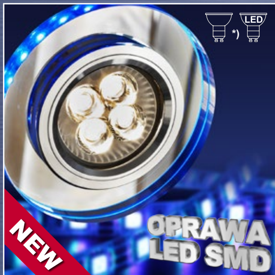
ART. 2226965 klasa energtryczna: A++ do E SS-23 CH/TR GU10 50W+SMD 230V NIEBIESKI 2,1W CHROM OPR. STROP. STAŁA OKRĄGŁA SZKŁO TRANSPARENTNE moc max: GU10 MAX 50W + SMD 2,1W efektywność świetlna: 110 lm/W temperatura barwowa: 6500 K; trwałość LED: 20000 h