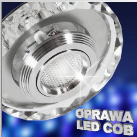
ART. 2228938 klasa energooszczędna: A+ SS-35 AL/TR 3W LED COB 230V OPR. STROP. STAŁA SZLIFOWANA SZKŁO TRANSPARENTNE; moc max: LED COB 3W; efektywność świetlna: 90 lm/W; temperatura barwowa: 3000 K; trwałość LED: 20000 h